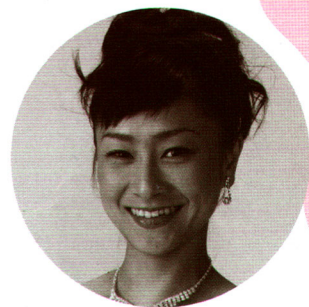
ソプラノ 池田綾乃